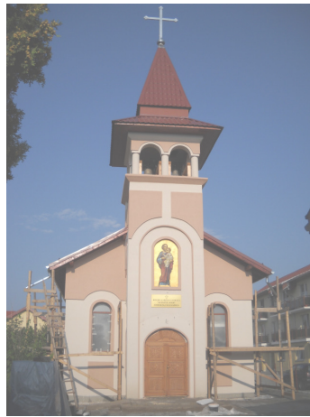
Biserica Greco-Catolică "Sf. Iosif"